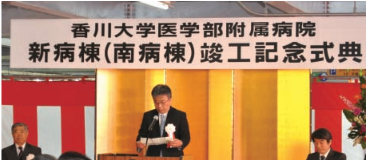
▲横見瀬病院長の式辞

医学部附属病院は、病院再開発事業の第一期工事である新病棟(南病棟)が3月末に竣工したことから、香川大学医学部附属病院新病棟(南病棟)竣工記念式典が5月18日(日)に開催されました。