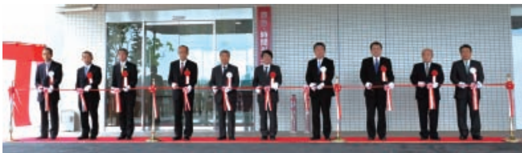
▲南病棟玄関前でのテープカット

その後、病院長から工事施工に尽力された方に感謝状が贈呈され、白神副病院長から新病棟(南病棟)の施設概要説明の後、同病棟入口前で代表者によるテープカットが行われました。式典に引き続き、新病棟(南病棟)の内覧会があり、1階の救命救急センター、3階の集中治療部、新設の心臓血管センター、病棟4階から望める3階屋上緑化や7階の無菌エリアをご案内しました。