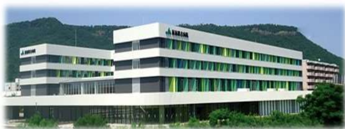
新築移転病院 2016年11月診療開始