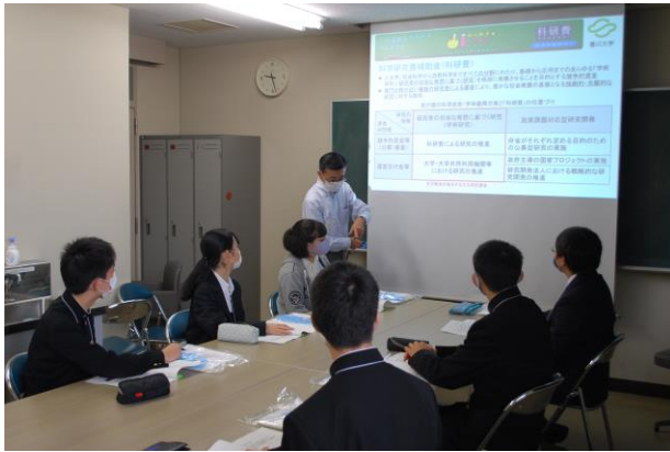
講義風景(科学研究費補助金の説明)