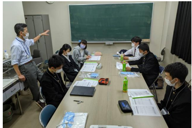
考察・質疑応答時間の様子