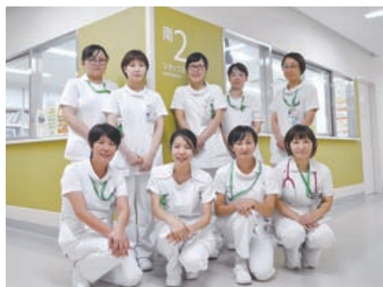
南病棟2階 スタッフ集合写真