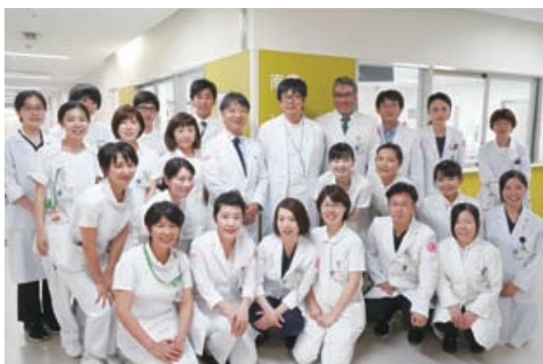
周産期科女性診療科 集合写真