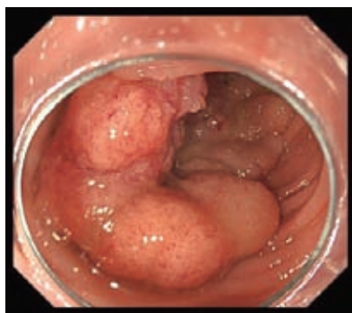
写真1:早期大腸癌7cm 大