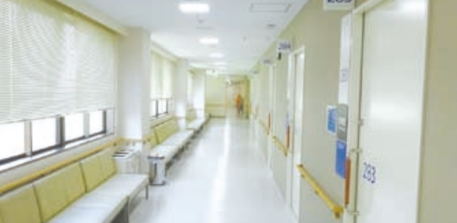
▲外周廊下側の待合