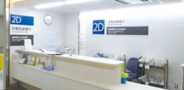
▲周産期科女性診療科外来