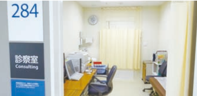
▲284診察室(泌尿器科外来)