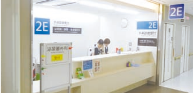
▲泌尿器・副腎・腎移植外科外来