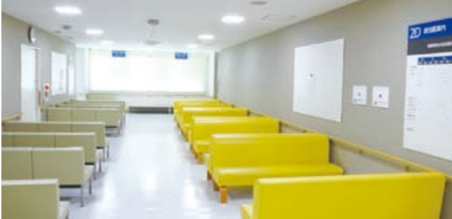
▲アイランド箇の待合