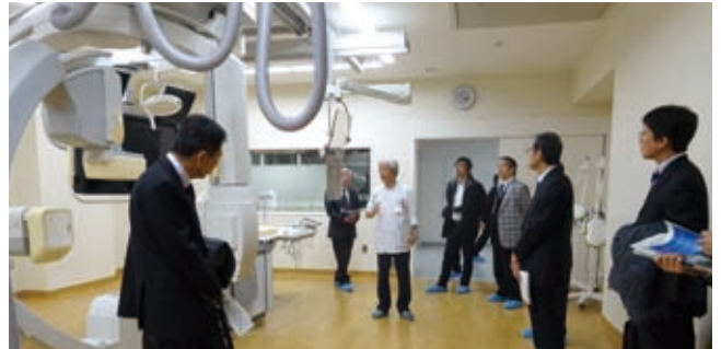
▲1階 放射線部 心血管撮影室