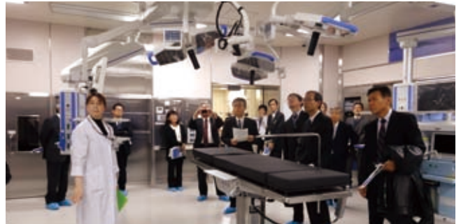
▲3階 手術部 ダ・ヴィンチ対応手術室 (OR1)