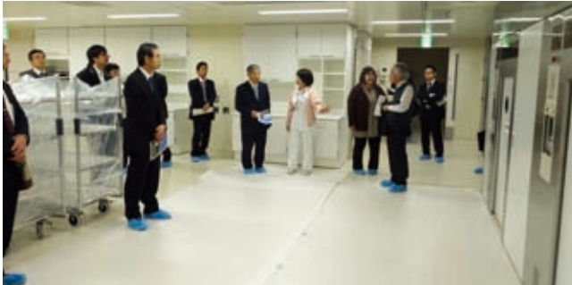
▲2階 材料部 高圧蒸気滅菌装置