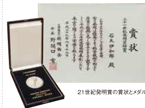
21世紀発明賞の賞状とメダル

出すことなく血糖値の測定ができます。尿の中のアルブミン量を計り腎臓機能を調べるスマートトイレも夢ではありません。これらは、医学部との連携で研究が進められ、今後も実用化に向け、さまざまな取り組みが続きます。自宅で手軽に健康状態が見分かる装置は、高齢化でさらに医療費増大が見込まれる日本の救世主になりそうです。